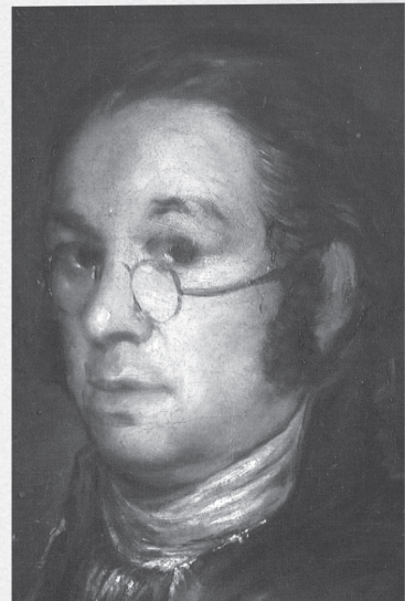
Hace 250 años, Goya era moderno. Fue un tipo innovador.

Goya demuestra que el arte puede también estimular la inteligencia. Por eso es necesario que nuestros niños se integren y participen