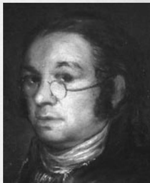
Hace 250 años, Goya era moderno. Fue un tipo innovador.

espíritu libre y un humanista – fue un tipo innovador. Un artista que acompañó la evolución de un mundo, que pasó de las monarquías a las nacientes democracias. Condenó la violencia en sus obras Los Desastres de la Guerra , exaltó la belleza con La Maja Vestida , y retrató las costumbres de su tiempo en La Vendimia .